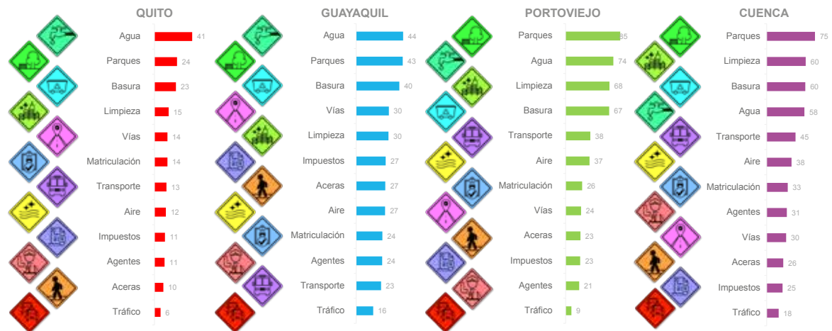
Rankings de satisfacción de servicios En las cuatro ciudades, la movilidad es un desafío.

Esta información es fundamental para consultar, mejorar y potenciar los servicios públicos, a favor de la ciudadanía, sobre todo, que están en competencia de los gobiernos locales.